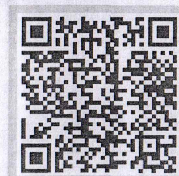
โครงการสุขภาพนักเรียน ปีครบสมัคร 2 ก.พ. 68