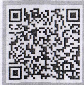
ประกวด คลิปวิดีโอ ในหัวข้อ "Save Love Smart Teens" เขตสุขภาพที่ 3 ปีครบสมัคร 31 ม.ค. 68