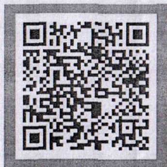
ประกวด คลิปวิดีโอ ในหัวข้อ "STOP TEEN MOM" เขตสุขภาพที่ 3 ปีครบสมัคร 31 ม.ค.68