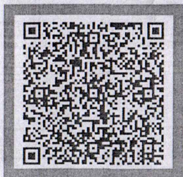
การแข่งขันกระโดดเชือก 68 ปีครบสมัคร 16 ม.ค. 68