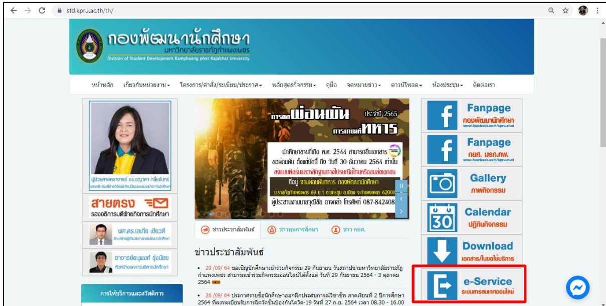
ภาพที่ 1 แสดงหน้าเว็บไซต์กองพัฒนานักศึกษา